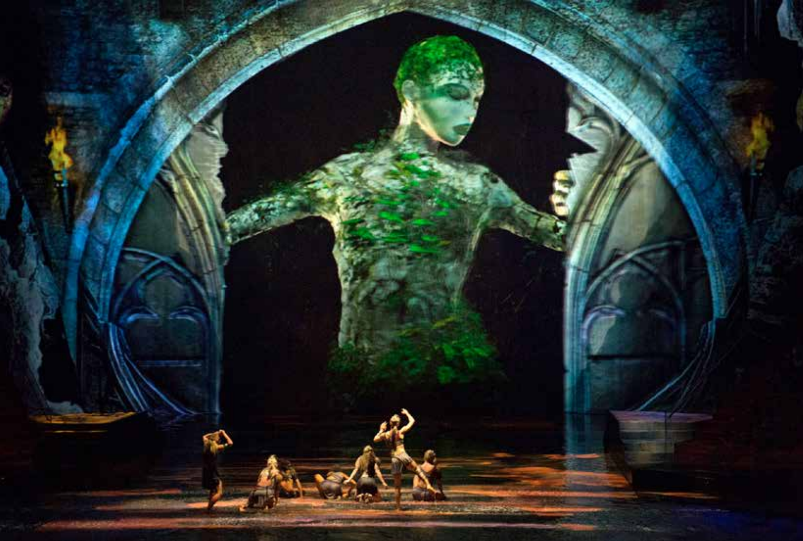
Stora påkostade shower som denna blir nya lockelser på Macaos olika kasinohotell.