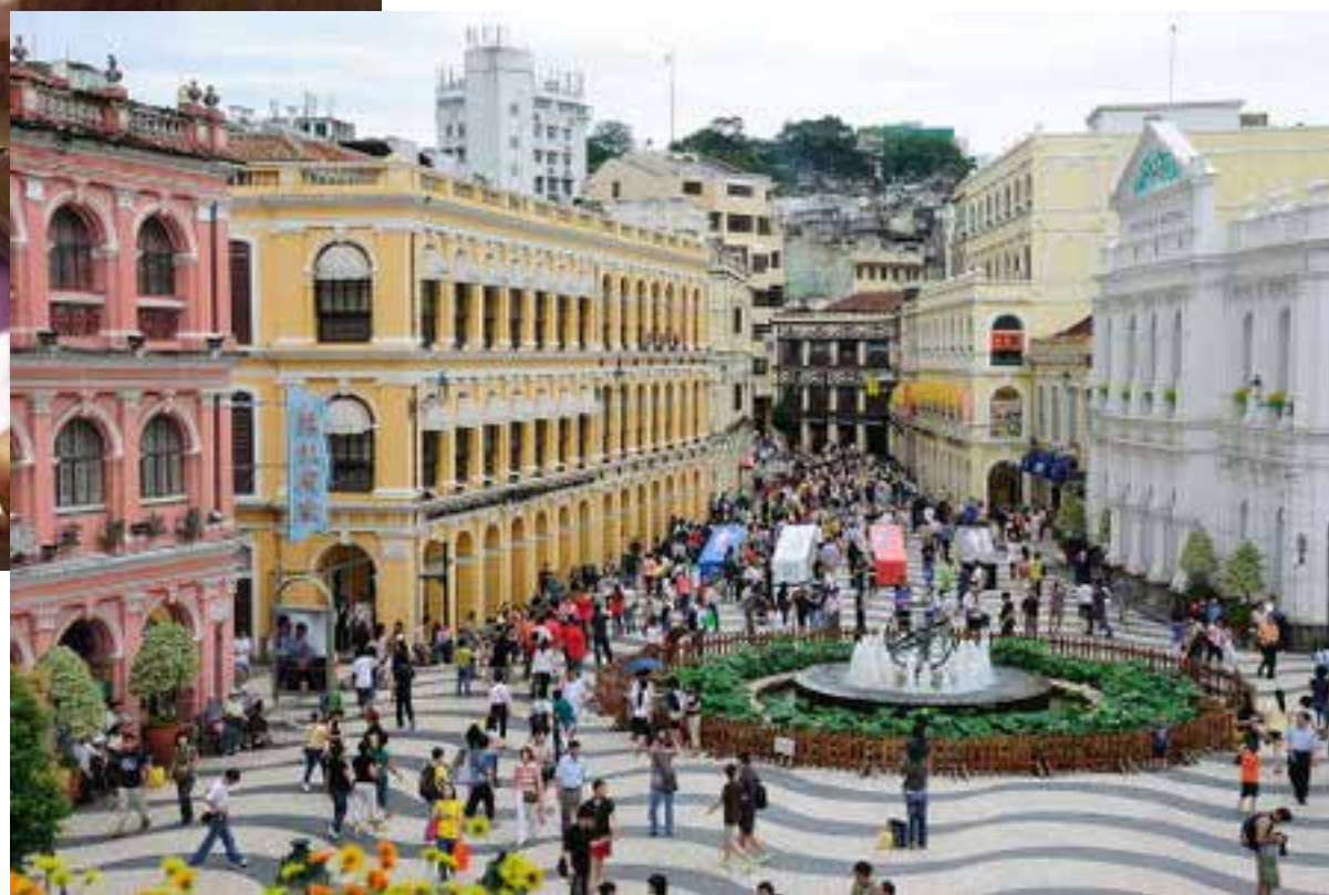
Världens största vattenshow "The House of Dancing Water" symboliserar det nya Macao där familjevänlig underhållning ska locka mer än spelhallarna på kasinohotellen. Samtidigt ska den stora massan av besökare styras bort från den gamla portugisiska stadskärnan (bilden till höger). Besökarna kommer i stället direkt till nya området Cotai.

Macao går på en och samma gång igenom en djup kris och en entusiastisk byggboom. Det är intressanta tider ur många synvinklar.