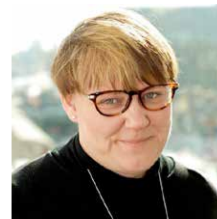
Birgitta Ed "Jag har aldrig varit så bekymrad över Kina som de senaste veckorna."