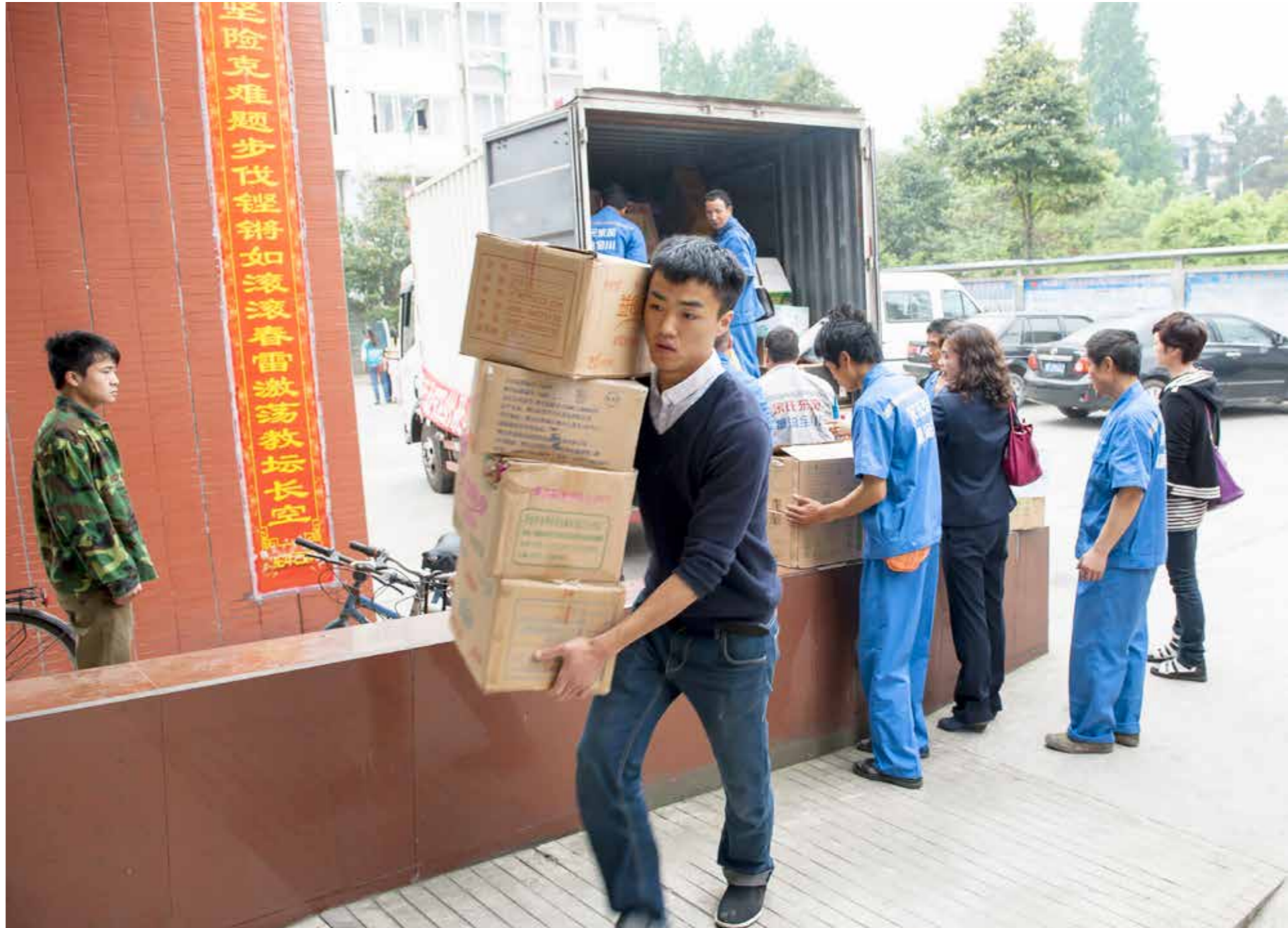
Frivilliga bär förnödenheter vid jordbävningen i Ya'an i Sichuan 2013.

Åtstramningen berör även utländska företag i Kina och påverkar det globala maktspelet. Fjolårets protestväg i Hongkong är också en faktor. ▶