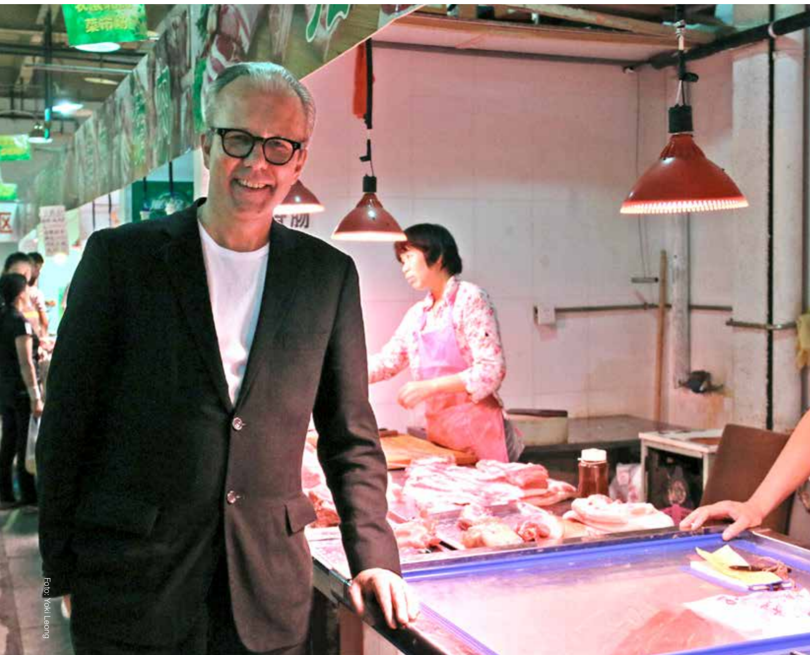
Lennart Nilsson på besök i en av Pekings saluhallar vid en butik som säljer griskött.