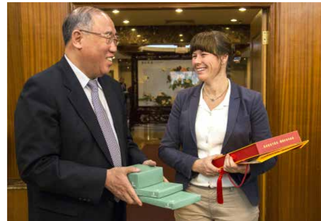
Miljöminister Åsa Romson ser möjligheter för svenska företag inom miljöteknik efter sitt besök i Kina i april. Åsa Romson träffade bland andra Xie Zhenhua, före detta miljöminister, numera Kinas chefsförhandlare i de internationella klimatförhandlingarna. Han är också vice ordförande i regeringens mäktiga reformkommission.

Men med de ökningarna av utsläppen som redan skett blir det ytterst svårt att klara målet att begränsa den globala temperaturhöjningen till 2030 till två grader, konstaterar hon. Kinas utsläpp per invånare har redan