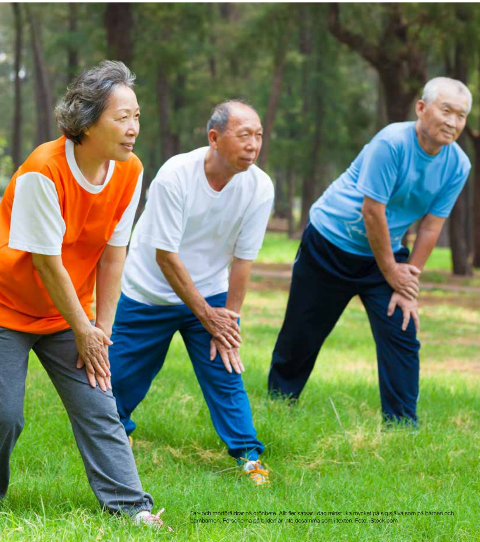
Far- och morföräldrar på grönbete. Allt fler satsar i dag minst lika mycket på sig själva som på barnen och barnbarnen. Personerna på bilden är inte desamma som i texten.