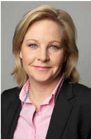
Arbetsmarknadsminister Hillevi Engström besökte nyligen Kina för första gången.