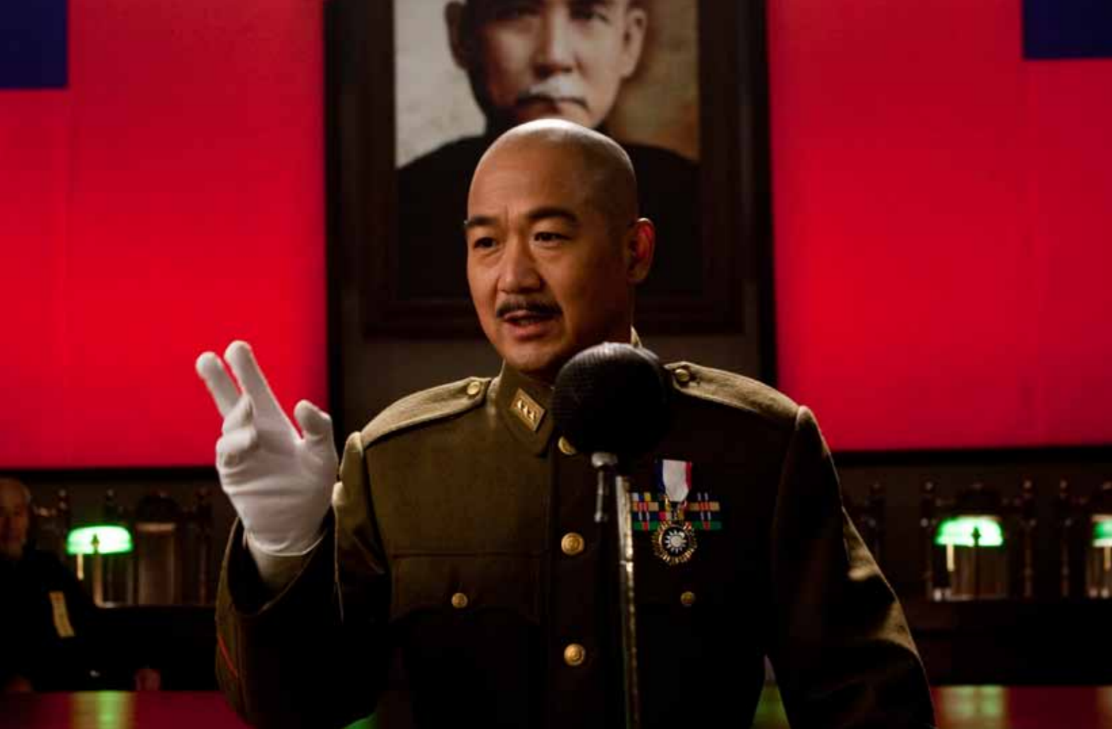
Chiang Kai-shek, ledaren för nationalistpartiet KMT, gjorde anspråk på att övertaga den kinesiska revolutionens uppdrag från Sun Yatsen, vars porträtt syns i bakgrunden. Även kommunisterna säger sig värda arvet från Sun Yatsen, men ännu hundra år efter den första revolutionen dröjer demokratin. Bilden är från spelfilmen "Grunddet av en republik" som gjordes till folkrepublikens 60-årsdag 2009.

För hundra år sedan störtades kejsardömet