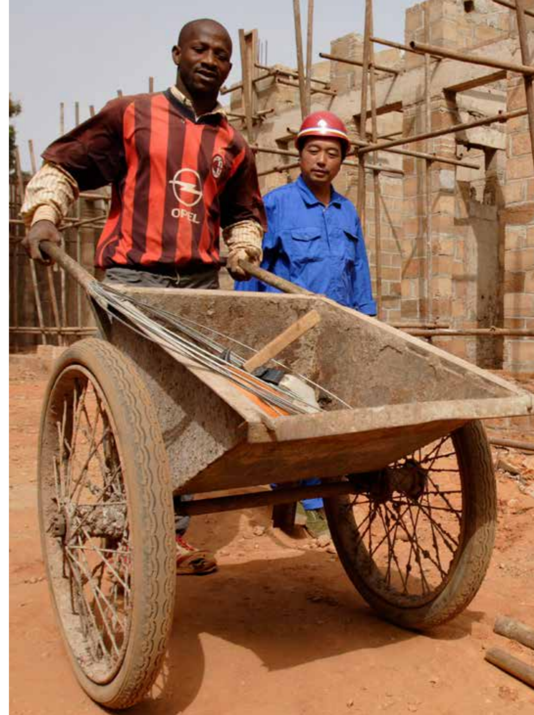
En arbetare i Guinea-Bissau övervakas av en kinesisk förman. Bygget av bostäder för officerare är en gåva från kinesiska regeringen. Kinas närvaro i Afrika med regeringsprojekt och med privata företag ökar snabbt. Det är också ett givet ämne att bevaka för den kinesiska tevekanal som dragit igång på den afrikanska kontinenten.

"Men jag tror att hans (radiochefens) svar återspeglar den pragmatism och teknokratiska inställning som präglar den kinesiska politiken i allmänhet i dag. Den inställningen visar sig i de-