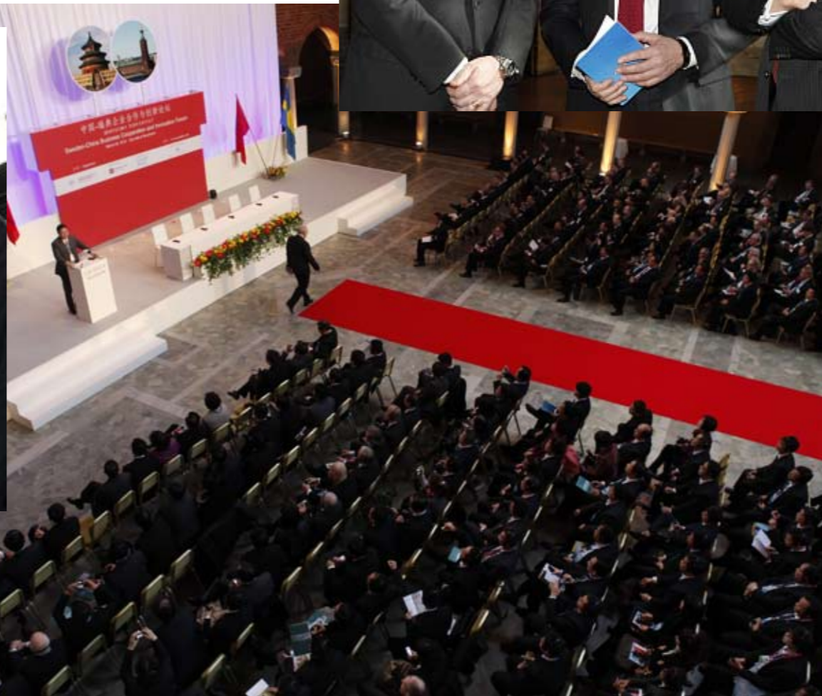
Stockholms Stadshus var fullsatt när vice president Xi Jinping gästade Sverige i slutet av mars.