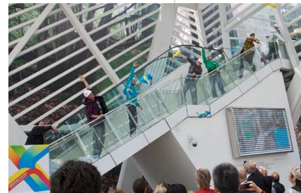
Dansgruppen Complete Dance Company fångade allas uppmärksamhet vid invigningen av den svenska paviljongen vid världsutställningen i Shanghai den 1 maj.

Jag tror att vi kommer se kinesiska beslutsfattare framför allt vid företagets egna aktiviteter, vid seminarier och andra riktade aktiviteter. Vi, kommittén för det svenska deltagandet, är själva värd för fyra större Forum som rör dagsaktuella teman i Kina: innovationssystem, hållbar stadsutveckling, välfärdssystemens utveckling och företagets sociala ansvar. De kinesiska beslutsfattarna kommer också att hitta intressanta saker i utställningen och vi hoppas att de också vill åka i Ulf Rollofs fantastiska rutschkana.