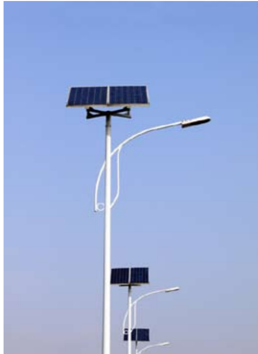
Längs motorvägen invid Tai Lake i Wuxi, i Jiangsuprovinen, drivs belysningen med hjälp av solpaneler. Detta är bara ett av många projekt i Kina med inriktning på energibesparande åtgärder. Hållbart energiutnyttjande står högt på dagordningen.

ÖSTRA KINA fortsätter sin ekonomiska tillväxt, men det är inte Shanghai som är motorn längre utan grannprovinserna Jiangsu och Anhui som under 2009 hade Kinas högsta tillväxtsiffror 2009 skriver svenska generalkonsulatet i Shanghai i en ny rapport.