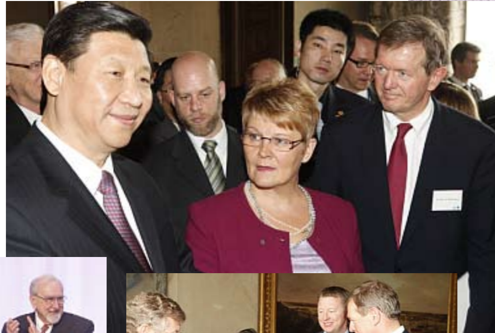
Maud Olofsson välkomnade Xi Jinping till Stadshuset i sällskap av bland andra Marcus Wallenberg.