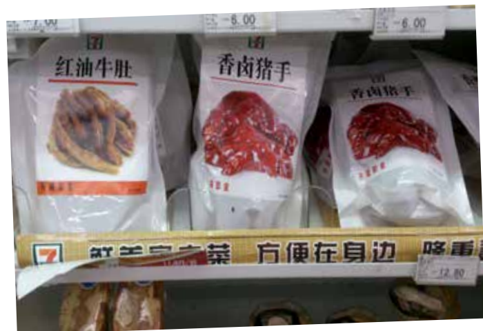
Oxtunga och grisfötter. Påsar med snacks på 7-eleven i Shanghai.