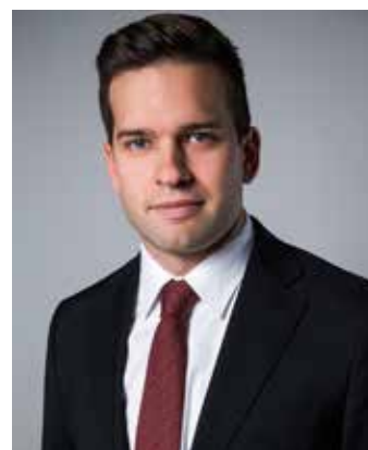
Folkhälso-, sjukvårds- och idrottsminister Gabriel Wikström leder en affärsdelegation till Kina i april.