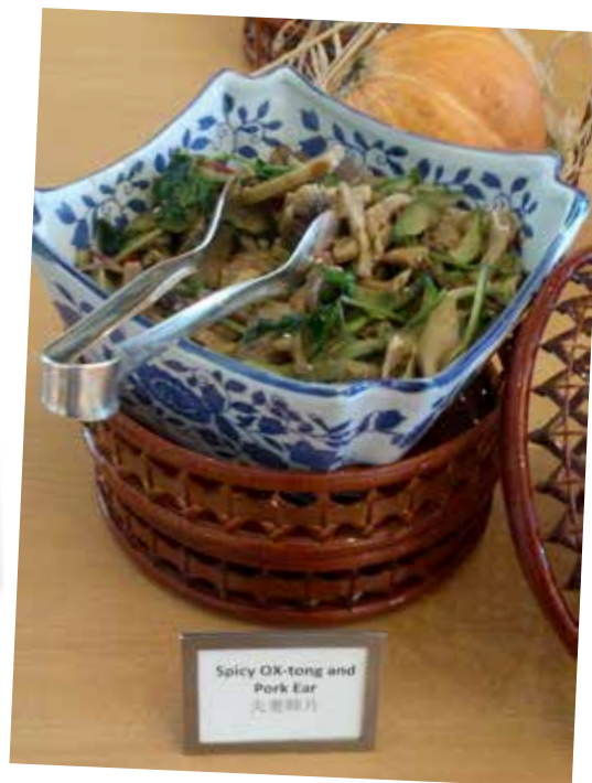
Kryddstark oxtunga och grisöron. Även grisfötter och oxmage fanns på en buffé på ett av Shanghais finaste hotell.