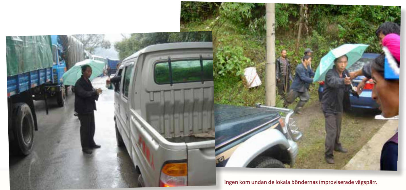
Ingen kom undan de lokala böndernas improviserade vägspärr.